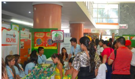
Die Schüler des Colegio Técnico Adolfo Kolping bei ihrem Stand während der Tourismusmesse. Sie möchten ihr Fachwissen in einem Tourismus-Studium an der Fachhochschule vertiefen.

Die Gemeinde San Sebastián de Mariquita liegt im Norden Tolimas. Obwohl der Tourismus die Hauptquelle für direkte und indirekte Beschäftigung ist, gibt es kein adäquates Bildungsangebot. Diese Lücke möchte Kolping mit einer gezielten Ausbildung füllen, um den Jugendlichen eine Perspektive zu bieten.